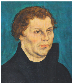
Martin Luther ca. 1525. Maleri af Lucas Cranach.

Den danske søndagsgudstjeneste er utænkelig uden salmesang. At synge salmer er den vigtigste måde, som menigheden deltagende aktivt i gudstjenesten på. Gudstjenesten, som vi kender den i Danmark, ville også være utænkelig uden vores fire store salmedigtere Kingo, Brorson, Grundtvig og Ingemann. Men sådan har det ikke altid været. Salmer på nationalsproget og at menigheden synger med på salmerne stammer fra reformationen. Martin Luther og hans medreformatorer afskaffede messesangen på latin. Men hvad skulle man så synge i kirkerne? Det var nødvendigt at skrive nye salmer, i første omgang på tysk og senere på dansk, fransk osv. Hvem skulle skrive dem? Luther og hans kollegaer måtte selv tage opgaven på sig. Og det gjorde de så. Og i år er det præcis 500 år siden, at de første evangeliske salmebøger udkom på tryk.