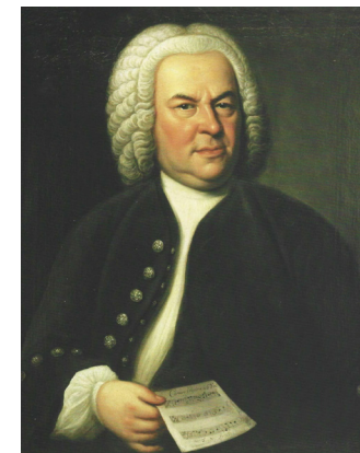
Johann Sebastian Bach, 1748.

Den svenske ærkebiskop Nathan Söderblom (1866-1931) har kaldt komponisten Johann Sebastian Bach (1685-1750) for "den 5. evangelist". Dermed mente han, at Bachs musik forkynder Evangeliet lige så "rent og purt", sådan som der står i præsteløftet, at præsten skal anstrenge sig for at gøre. Bach blev i 1723 ansat som leder af kirkemusikken i Leipzigs to store hovedkirker. Hans opgave var til hver søndag at skrive et musikstykke, en kirkekantate, over søndagens Evangelium. Stykket blev opført ved gudstjenesten lige efter præstens prædiken. I 1724 valgte Bach at skrive alle sine kantater over salmer, den såkaldte "koralkantateårgang" (på tysk hedder en salme en koral). Til de 40 kantater, som han skrev til søndagene i 1724 og 1725 valgte Bach som altovervejende hovedregel en "gammel" salme fra 1500- eller 1600-tallet. Otte eller 20% af de 40 kantater er skrevet over salmer af Martin Luther. I 2024 kan vi således fejre både 500-året for udgivelsen af de første evangeliske salmebøger og 300-året for Bachs koralkantateårgang, som nok er den del af hans musikalske arv, hvor han forkynder Evangeliet allermest "rent og purt".