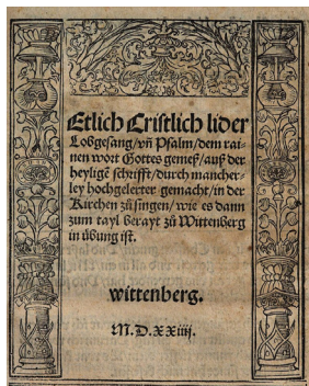
Titelbladet til Achtlieder- buch 1524.

Luther gør en fuldhjertet indsats og skriver selv omkring 40 salmer. De første fire blev trykt i den såkaldte Actliederbuch ("Ottesangsbogen"). Det var en meget beskedent tryksag, for den indeholdt, som navnet antyder, kun otte salmer. En af dem var Nu fryde sig hver kristen mand (i dag nr. 487 i Den Danske Salmebog (DDS)). En anden var Af dybsens nød (DDS 496), der lige som flere andre af de første salmer er en gendigtning af en salme fra Salmernes Bog i Det Gl. Testamente (Sl. 130). En tredje salme fra bogen var Guds søn kom ned fra Himmerig af Paul Speratus (1484-1551), som også stadig kan findes i vores salmebog (DDS 488). På titelbladet står der, at bogen er trykt i Wittenberg, men i virkeligheden blev den trykt i Nürnberg. Flere steder var Luthers tyske bibeloversættelse blevet forbudt af de fyrster, som fortsat støttede den katolske kirke. Hvis bogen skulle blive beslaglagt og brændt, så var det klogt at kaste